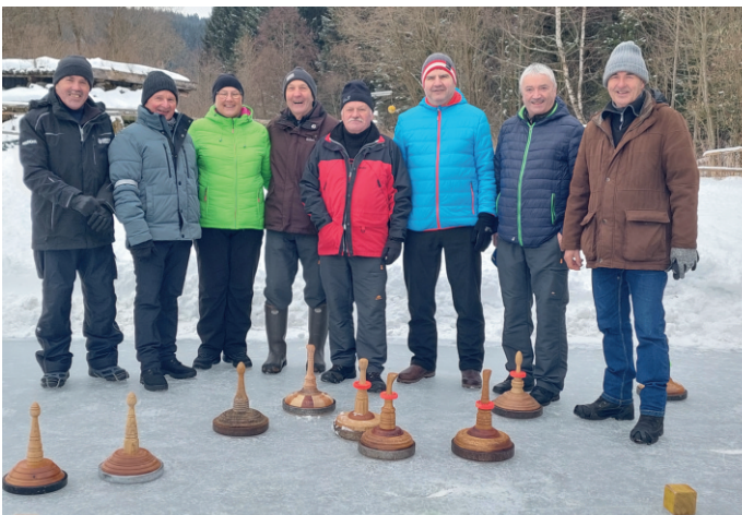
Eisstockschießen in der Fichtmühle

Höhepunkt nach mehrwöchigen Eisstockpartien in der Fichtmühle war die Teilnahme am Bezirks-Eisstockturnier in Weitersfelden. Bei guten Eisbedingungen und sportlich-kameradschaftlicher Atmosphäre stellten sich zwei Moarschaften aus UW dem Wettkampf. Unsere zwei Teams zeigten großen Einsatz und bewiesen ihr Können im Stocksport.