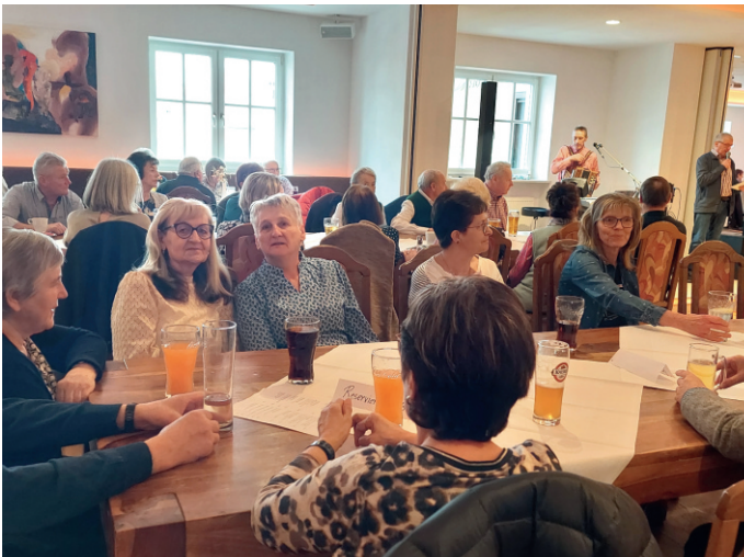
Seniorenball im Hotel Fürst

Der Seniorenball stand auch heuer wieder im Zeichen von Kameradschaftlichkeit, Geselligkeit und gelebter Gemeinschaft. In fröhlicher Atmosphäre konnten wir ca. 170 Seniorinnen und Senioren aus den benachbarten Ortsgruppen zu unserm Ball begrüßen. Der Ball zeigte einmal mehr wie aktiv, offen und verbunden unsere Seniorengruppe ist.