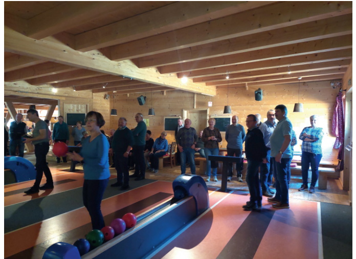
Kegeln auf der Hirschalm

Beim erstmals auf der Hirschalm veranstalteten SPIELE & KEGELN- Nachmittag waren 53 Mitglieder dabei. Großer Anklang fand das Mittagessen "Bratl in der Rain" sowie das Kegeln.