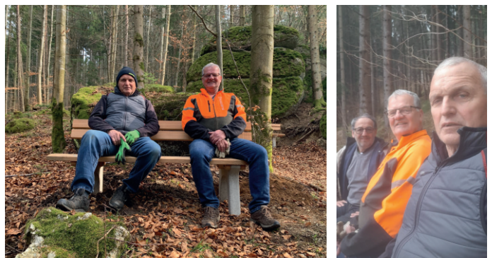
Nach getaner Arbeit

Der "Weißenbachtalweg 10" bereichert das Freizeitangebot der Gemeinde und bietet einen einfachen, aber vielseitigen Zugang zur Natur – ein Ausflugsziel für alle Generationen.