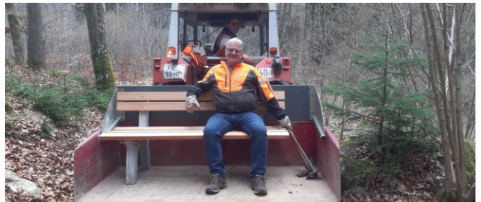
Transport der Sitzbänke

Sie laden dazu ein, eine Pause einzulegen und die Ruhe der Natur wirken zu lassen, während die Kinder in Ruhe spielen und auf Entdeckungsreise gehen können.